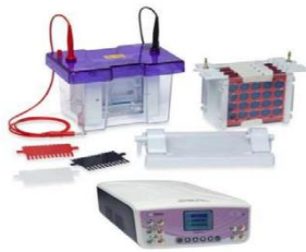
Imagem de referência:

Observação Adicional: Os itens I e II devem ser compatíveis entre si, embora possam ser comercializados de forma independente. Desta forma, a aquisição será realizada em conjunto considerando-se o menor valor global.