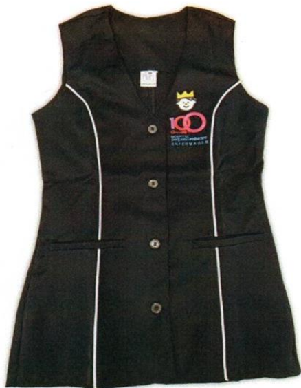
COLETE DE ENFERMAGEM