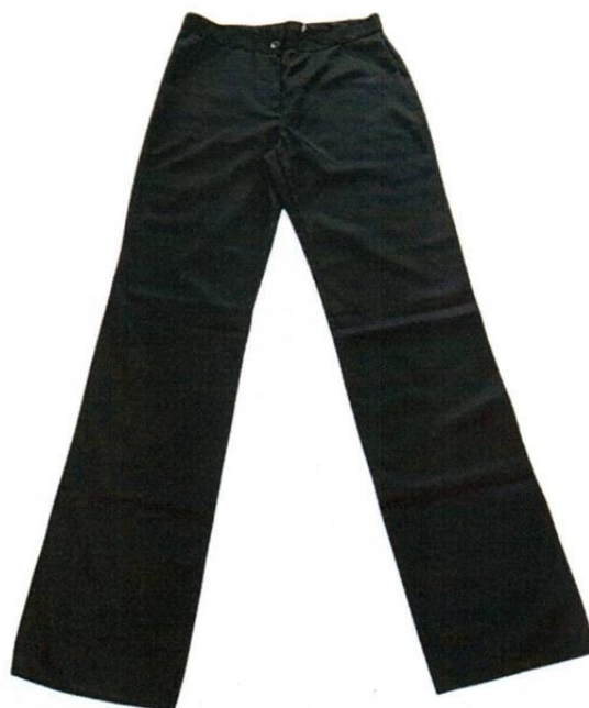
CALÇA SUPERVISÃO RECEPÇÃO