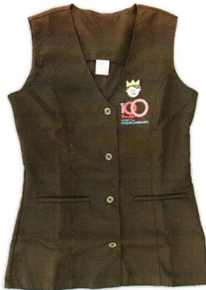
COLETE DE SUPERVISÃO DE RECEPÇÃO