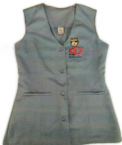
COLETE NUTRICIONISTA SND

Nos preços cotados, deverão estar incluídos todos os insumos que o compõe, tais como as despesas com impostos, taxas, frete, seguros, e quais quer outros que incidam direta e indiretamente no fornecimento do objeto.