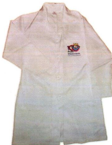
JALECO ENFERMAGEM MASCULINO