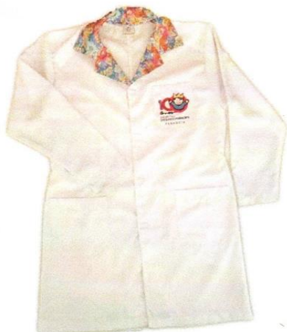
JALECO ENFERMAGEM FEMININO